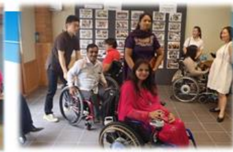
15.9 パキスタン3都市代表