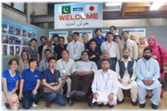
14.9 パキスタン行政官