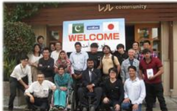
16.4 パキスタン・マイルズン代表