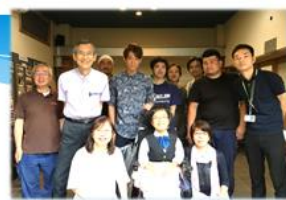
16.8 NEWS EVERY 小山さん