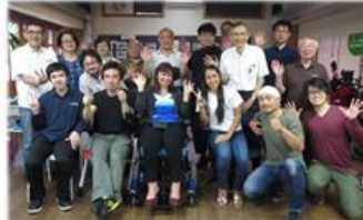
16.6 コスタリカ・CILモルフオ代表