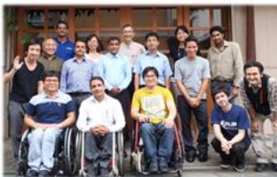
16.7 カンボジア、ネパール、モンゴル ベトナム、パキスタン