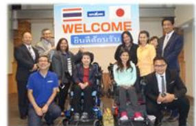
16.10 タイ・国立リハビリセンター