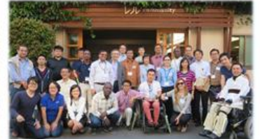
16.6 13か国 JICA研修生