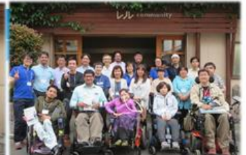
16.5 パキスタン・シャフィック