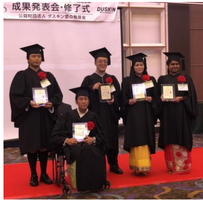
研修生は5カ国でした