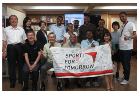
19. 8. エチオピア行政官