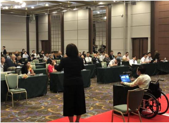
ミヨーミンさんの発表