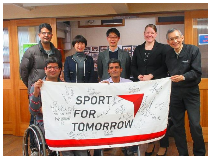
NHKのプロシューサーも参加