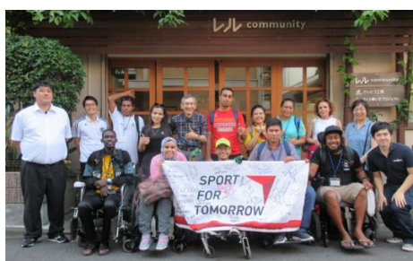
19. 8. ジ・イハ・ヨソ：JICA 11 カ国行政官