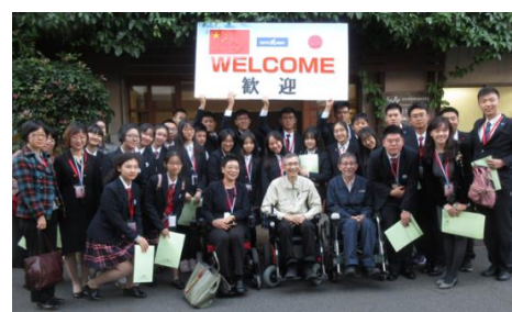
19. 11 中国上海市選抜高校生 30 名