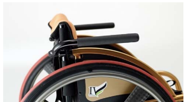
独立型 固定式の例

今回の改正から変更されました。 フレーム一体型と独立型に分けられました。 独立型とは、主に写真のような形状で本体フレームから独立した構造のアームサポートを指します。 跳ね上げ式、着脱式はフレーム一体型と同価格であることから、固定式でも独立型の場合は加算対象となります。