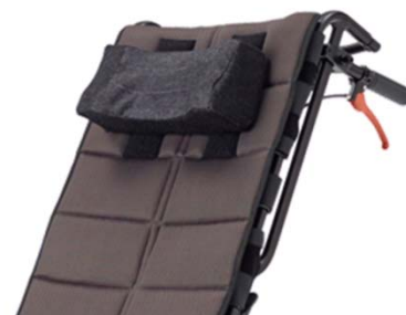
バックサポート一体型の例 (ヘッドサポートの併用不可)