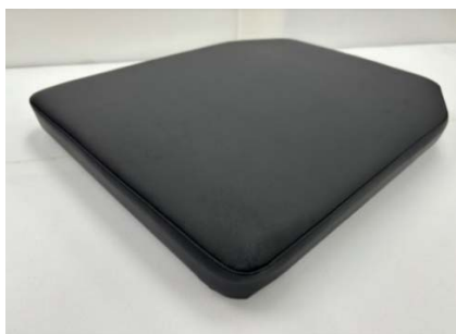
座板 クッション一体型の例