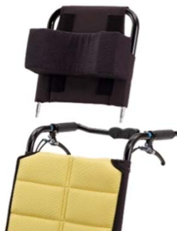
ヘッドサポート着脱式の例