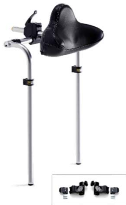
ヘッドサポートマルチタイプの例

なお、修理の際にオーダーメイドの枕については、別途1,350円の加算が認められます。（修理基準の備考欄に記載あり）