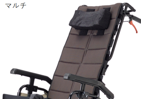
バックサポート延長の例

バックサポートパイプに着脱機構を付けないまま、頭部まで延長する場合に適用。 したがって、(ウ) 付属品のヘッドサポートの着脱式 (枕含む) 17,300円、マルチ タイプ (枕含む) 29,500円との併用は不可です。 枕はオーダーメイド、レディメイド共に併用可能です。